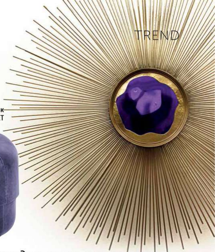
Пуф Circus от датского бренда Normann Copenhagen