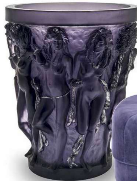
Ваза Sirènes из лимитированной серии французского бренда Laliq, дизайн Terry Rodgers

160 ЛЕТ RUBELLI. ТЕКСТИЛЬНОЕ ДОСТОЯНИЕ ИТАЛИИ