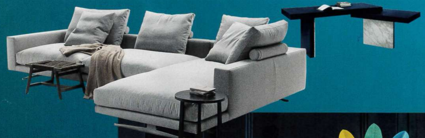
NEUE PERSPEKTIVEN Oben: Antonio Citterio's Sofa „Campiello“ (Flexform) lädt zum Loungen ein, dahinter der elegante Schreibtisch „Benjamin“ von Samuel Accoceberry (Mood by Flexform). Rechts: Federvieh aus Aluminium – ein Hingucker von Antonio Aricò (Altreforme)

Meeresrauschen am Kap der Guten Hoffnung, ein Schmuckkästchen an der Algarve und eine Liebeserklärung an Lausanne