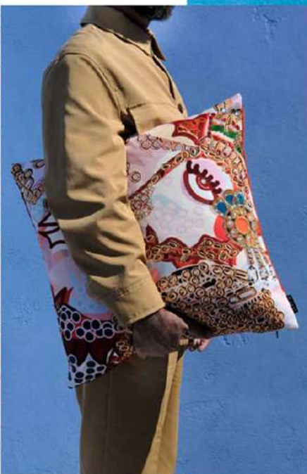
Right, Narciso, the beautiful peacock in love with his diadem and embellished with his blue and purple feathered cloak. Below, Kaulonius, the capricious and mischievous dragon who enchants friends and enemies with crazy spells.