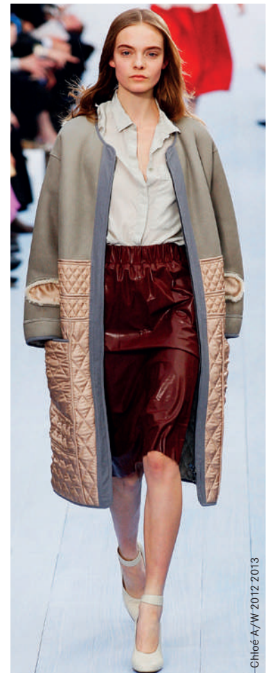
—Chloé A/W 2012 2013