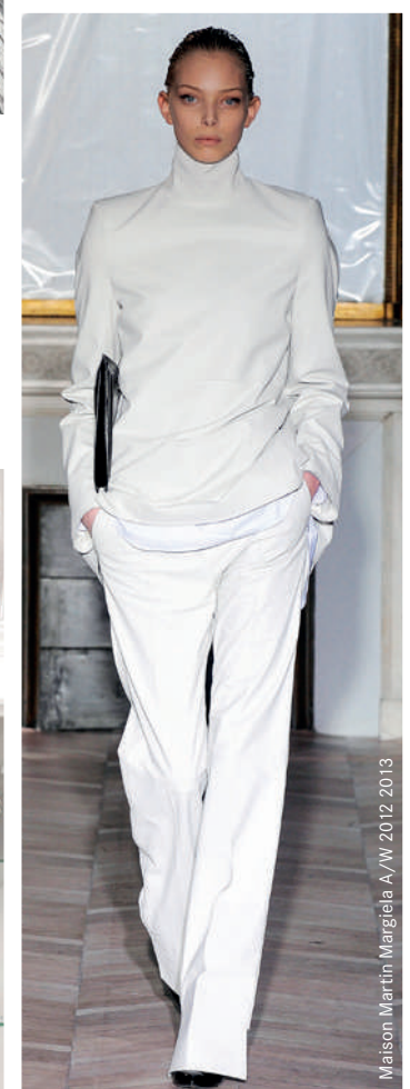
Maison Martin Margiela A/W 2012 20 13

Eind vorig jaar werd de Maison Martin Margiela winkel aan de Vlaamsesteenweg in Brussel na een grondige verbouwing heropend. Het modehuis kreeg een extra etage boven de bestaande winkel om zo het sterk toegenomen aantal klanten de juiste ruimte en service te bieden. De damescollectie is op de begane grond gebleven en de herencollectie is verhuisd naar de Gentlemen's private club op de eerste verdieping van het pand. Kenmerkend voor het Franse modelabel is natuurlijk het consequente gebruik van trompe-l'œil en spiegels die de optische illusie versterken. Ook het hergebruik van materialen en oude meubels, witte kledingrekken en meubelhoezen, collages van zwart-wit fotokopieën en de in ruime kasten uitgestalde accessoires zijn typisch Maison Martin Margiela. maisonmartinmargiela.com