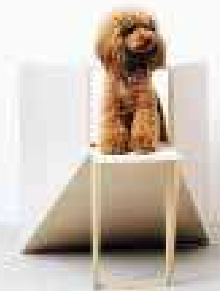
01-02. 设计师原研哉和 D 形隧道，他本人设计的一款胶合板装置，为茶杯贵宾犬 (Teacup Poodle) 设计。